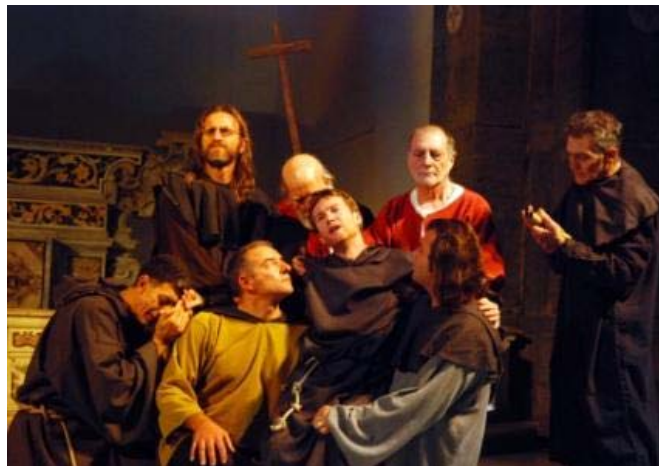
Napoli, 28/11/2009, chiesa di S. Severo Al Pendino. Lo spettacolo proposto insieme a venticinque partecipanti

Il corso formativo ha la durata di 6/7 giorni. I partecipanti vengono guidati dagli artisti interpreti in tutte le fasi di studio che normalmente compongono le prove di uno spettacolo di questo tipo: analisi del testo – lettura dei brani – suddivisioni dei ruoli- presenza scenica – lavoro coreografico – senso e suddivisione delle prove – prove costumi – prove dello spettacolo e tecniche di concentrazione prima del debutto. (Lo spettacolo finale è sempre gratuito, la settimana di lavoro prevede quote di partecipazione.)